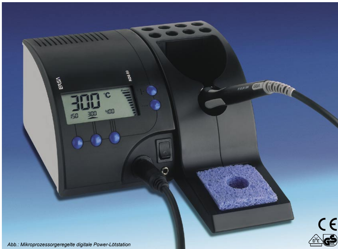
Abb.: Mikroprozessorgeregelte digitale Power-Lötstation