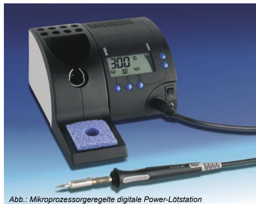
Abb.: Mikroprozessorgeregelte digitale Power-Lötstation

Neben beliebiger Temperaturwahl zwischen 150°C und 450°C können 3 Festtemperaturen oder 2 Festtemperaturen und eine Standby-Temperatur programmiert werden.